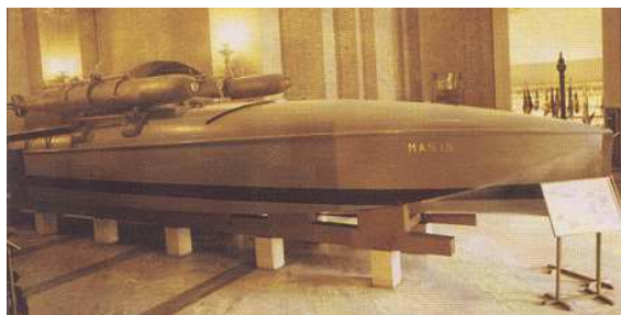
Il MAS 15 conservato nel Vittoriano

L'articolo si chiude con un invito ai lettori a cimentarsi nella costruzione, richiedendo, se necessario, chiarimenti, consigli e suggerimenti all'AMIREL.