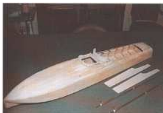
Alcune fasi della costruzione del modello