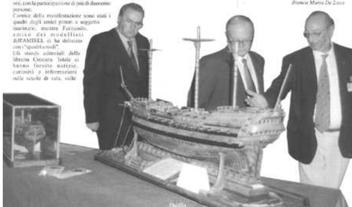
L'articolo sulla mostra pubblicato sulla rivista "Duilio - Litorale" - ott 1999