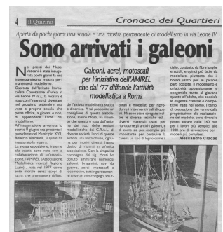
Il Quirino 15 giu 2002

Nel prossimo numero potrete leggere l'articolo con cui la stampa di quartiere ha commentato l'avvenimento.