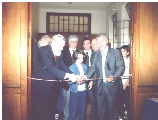
Il taglio del nastro della Mostra e della Scuola di Modellismo