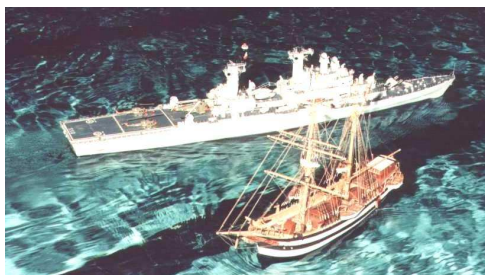
Modelli in evoluzione