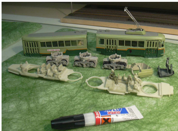
Vista del modello smontato nei suoi componenti

Ora vi descriverò le modifiche eseguite sull'ultimo modello, la vettura serie 7000. La Circolare Rossa, smontata nelle sue componenti si presentava come nella figura seguente (notare le dimensioni se confrontate con un tubetto di Attak).