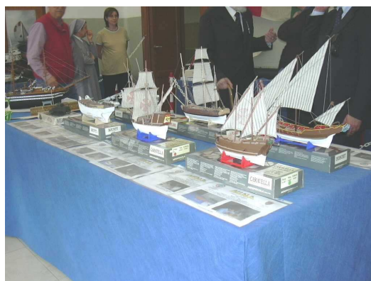
La mostra dei modelli realizzati nella scuola