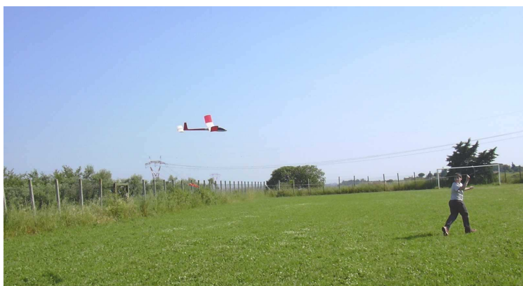
Uno dei veleggiatori durante le prove di volo alla Città dei ragazzi