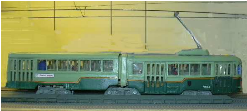
La vettura completata e montata