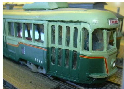
I nuovi cartelli di percorrenza, le matricole ed il conducente