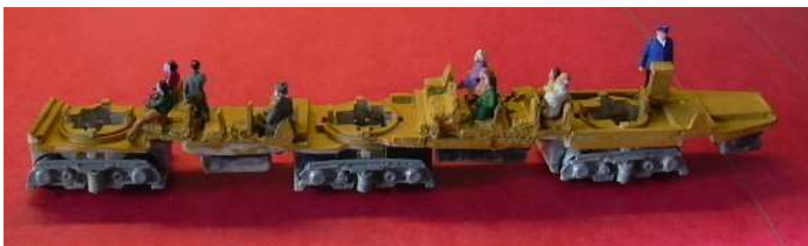
Gli interni migliorati e verniciati

Il conducente con il suo supporto, dopo essere stati opportunamente verniciati, sono stati incollati direttamente nella parte anteriore della carrozzeria, per facilitare il successivo montaggio.