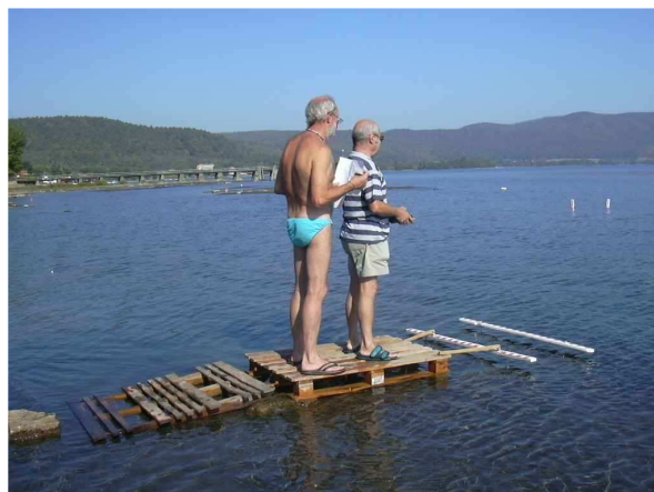
Concorrenti all'opera nelle gare dello scorso anno